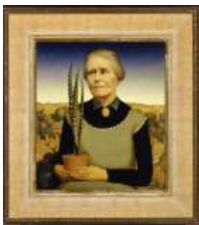
Grant Wood, Mujer con plantas , 1929. Óleo sobre retablo, 20 ½ x 17 7/8 in. Cedar Rapids Museum of Art. Compra del museo 31.1

Sea lo que sea que estas plantas simbolicen, podemos ver que contribuyen a la composición total: los geranios reproducen la forma de los árboles detrás de la casa y las tres hojas de la lengua de suegra se repiten de nuevo en menor escala en el patrón de la ventana, el trinche y las costuras del overol de trabajo.