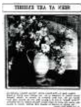
Ottumwa Courier, agosto 5, 1930

Rowan usaba artistas locales y obras disponibles para mantener bajos los gastos. Los artistas también daban pláticas al público y oportunidades educativas. Uno de los artistas invitados fue Grant Wood.