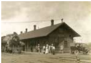
Rock Island Railroad Depot.

Desafortunadamente, el sueño de Rowan de que las exhibiciones despertaran suficiente interés en Ottumwa como para comenzar también allí un museo de arte nunca se materializaron.