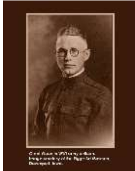
Grant Wood en el uniforme militar de la primer Guerra Mundial.

Grant pasó los siguientes años puliendo sus habilidades. Comenzó un taller propio de cobre y joyería por un tiempo en 1912. En Iowa City en el año escolar 1912-13 asistió a una clase de dibujo al natural sin registrarse o pagar la matrícula. Pasó un tiempo en 1913 en el Instituto del Arte de Chicago estudiando arte. Para pagar las cuentas en Chicago, continuó con su trabajo de joyería.