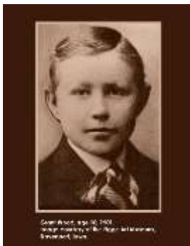
Grant Wood, 10 años de edad, 1901.

~Margaret Thoma, 1942 "Perder de vista el humor sutil y silencioso de Grant Wood sería malentender al hombre por completo. Hay un poco de amargura y sátira en él, así como mucha ingenuidad e ingenio y una infinita capacidad de ver el lado más humorístico de sí mismo." –Margaret Thoma, 1942.