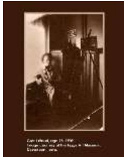
Grant Wood, 18 años de edad, 1909.

El siguiente año, en 1906, Grant entró a la preparatoria Washington. Allí conoció a otro estudiante que se convertiría en un amigo de por vida, Marvin Cone. Los dos compartían un profundo interés por el arte y se convirtieron en amigos cercanos. Durante los años de escuela, pintaron la escenografía para distintas obras escolares, Grant hizo dibujos con pluma y tinta para el anuario y la revista de la escuela y comenzó a enseñarle a su hermana a dibujar. Grant y Marvin también sirvieron como voluntarios en la Asociación de Arte de Cedar Rapids, donde desempacaban pinturas para las exhibiciones y volvían a empacarlas cuando éstas cerraban. Grant incluso durmió en la galería algunas noches para cuidar las pinturas cuando éstas eran muy valiosas.