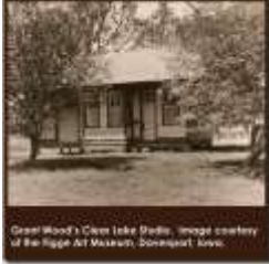
El estudio en Clear Lake de Grant Wood. Imagen cortesía del Figge Art Museum, Davenport, Iowa.

El estudio en Clear Lake de Grant Wood. Imagen cortesía del Figge Art Museum,