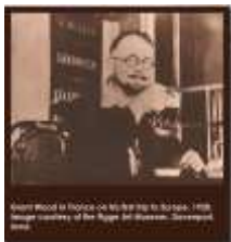
Grant Wood en Francia en su primer viaje a Europa, 1920.