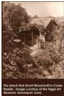
La casucha que Grant Wood construyó en Cedar Rapids.